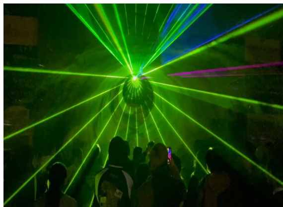
レーザーショーの様子