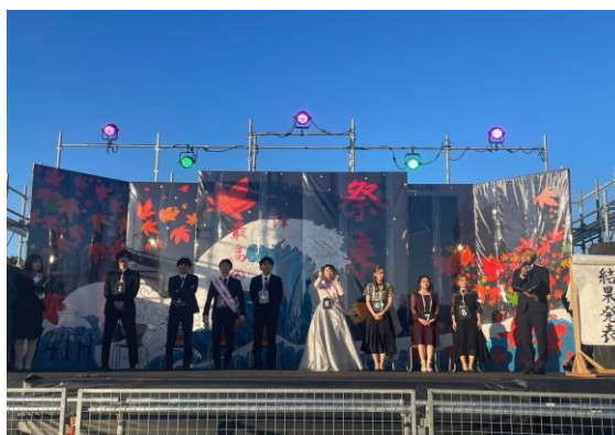
M1コンテストの様子