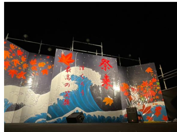
メインステージ制作の様子