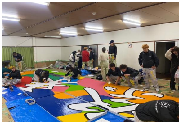
ステージバック作成の様子