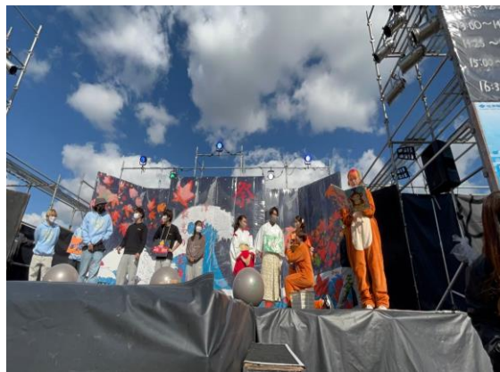
模擬店コマースルの様子