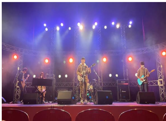
MMFステージ配信の様子