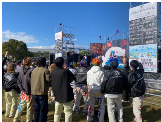
カレッジフェスタの様子