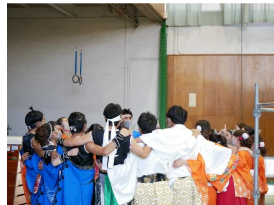
大学祭出演団体の皆さんの様子 7