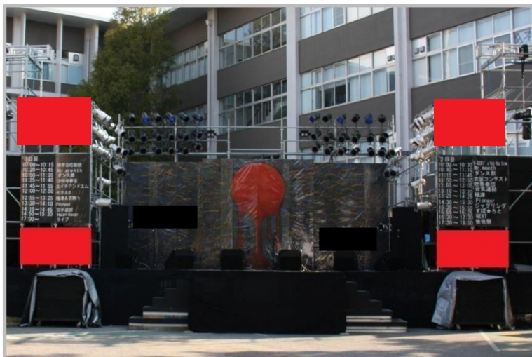
メインステージ広告イメージ