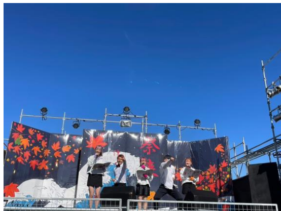
のど自慢コンテストの様子