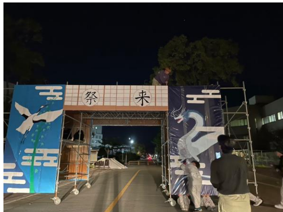
大学祭入場ゲートの作成様子